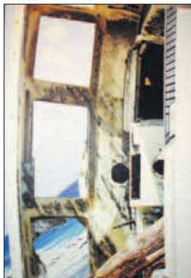
Een puzzelfoto. Hier is het belangrijk de horizon te herkennen. De onrust die de foto opwekt komt door de afwijkende stand.

Vlissingen is de eerste stad vanuit zee als we Nederland vanuit de Antillen benaderen. Het ligt aan de uiterst drukke vaarroute naar Antwerpen. Het stadje zelf was niet erg belangrijk. De schepen voeren liever door naar Dordrecht, bij de monding van de grote rivieren. Vlissingen heeft een kleine haven. Daar is het museum.