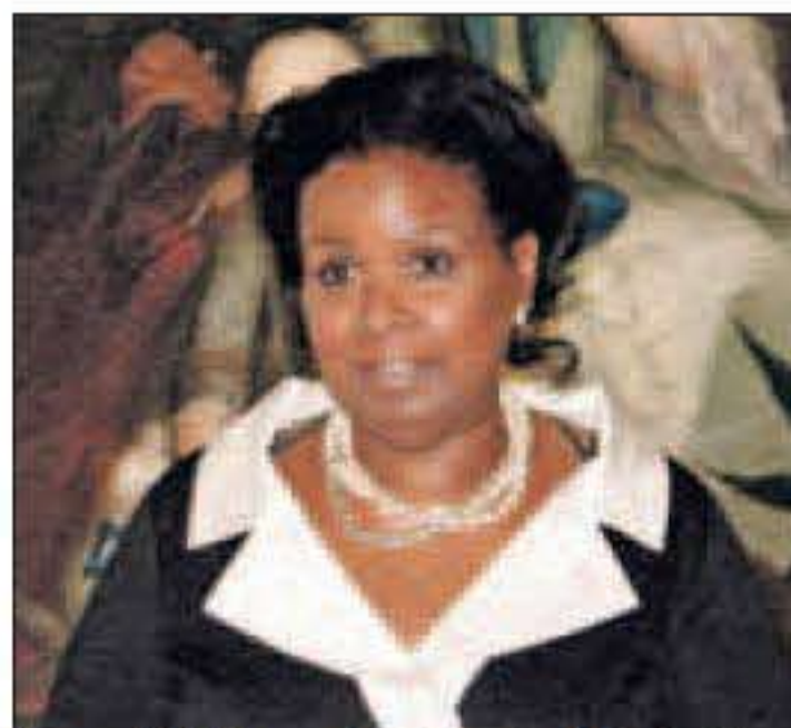
Mevrouw Wiels bij haar openingstoespraak: „Alles is leeur.“