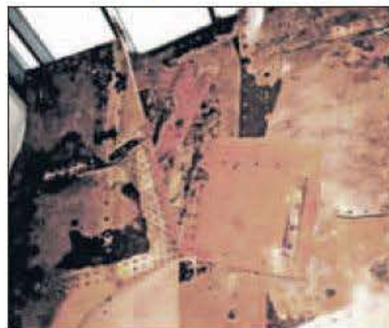
Voordat men naar beneden naar de kelderzalen gaat, is er een afscheiding tussen binnen en buiten: de ijzeren geroeste platen van een boot.