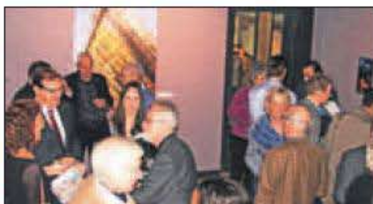
Het publiek in de kelderruimtes.