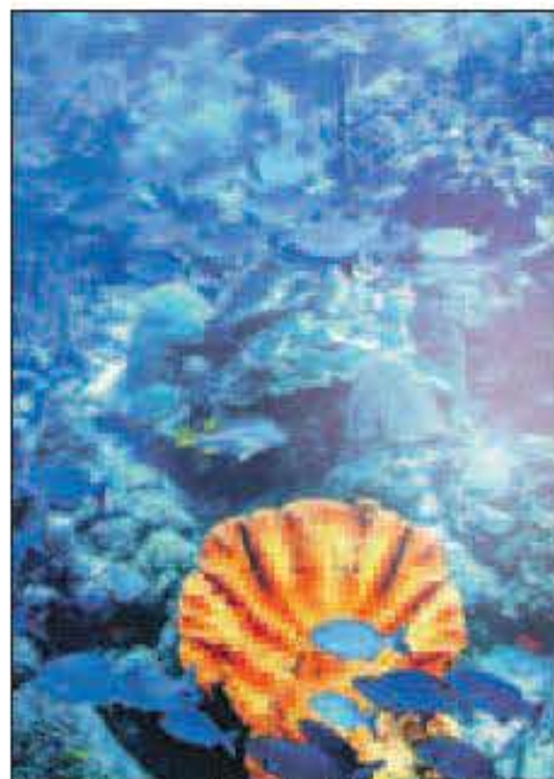
Hier zwemmen de vissen, die ooit in een 'gordijn' voor mij hingen.