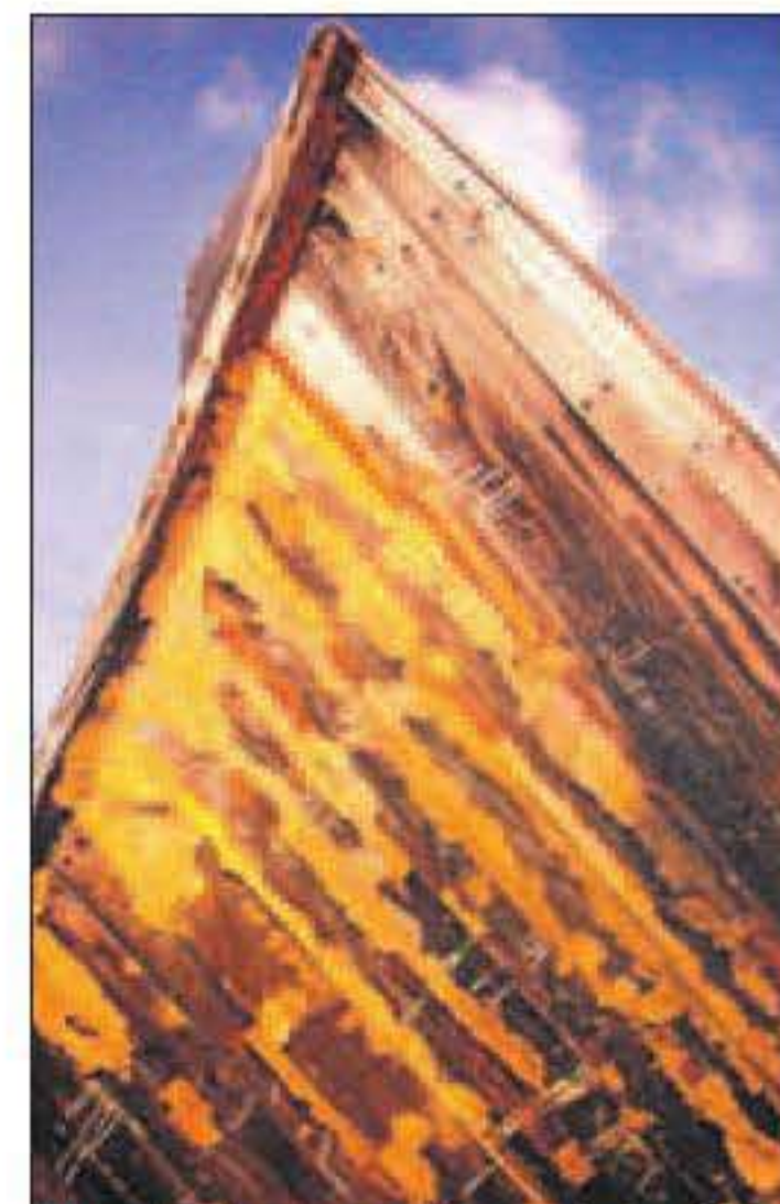
Fier staat het schip omhoog met de boeg. De huid is gebladderd.