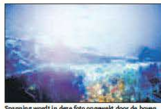
Spanning wordt in deze foto opgewekt door de boven zwemmende vissen. Aan scheepssden heeft zich koraal gevestigd.