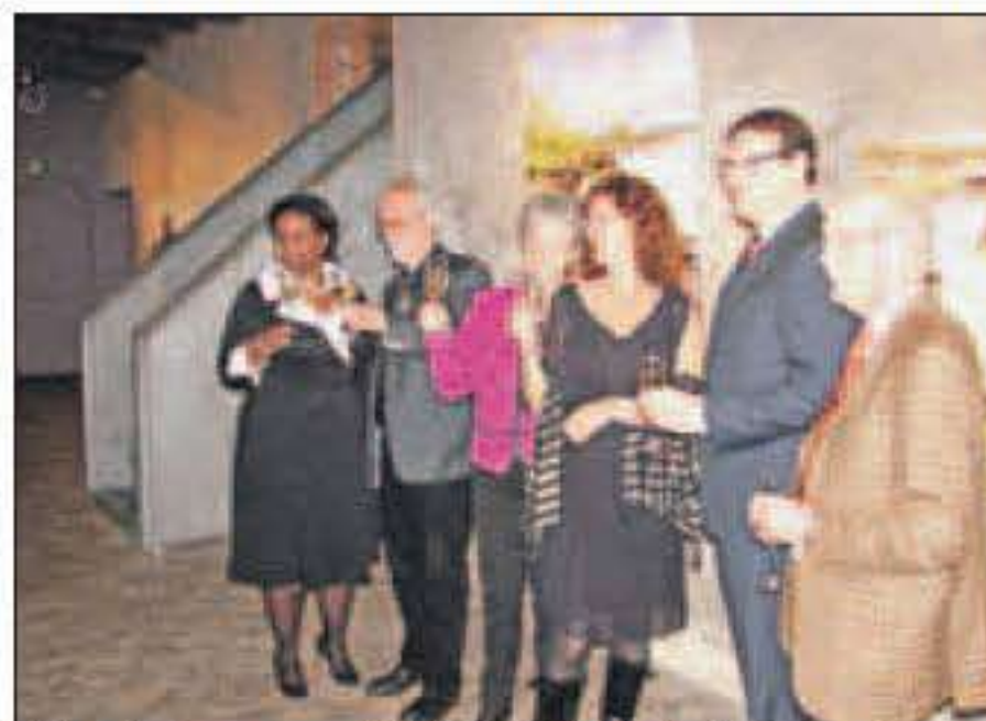
Met een glas champagne wordt de tentoonstelling daadwerkelijk geopend.

neden naar de kelderzalen gaat, is er een afscheiding tussen binnen en buiten: de ijzeren geroeste platen van een boot.