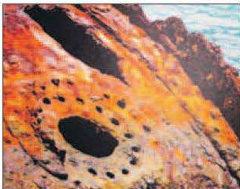
Hier lijken de gaten wel door de natuur uitgehouden. Het contrast met de zee is scherp.

De connectie van het museum met Curaçao kan ik herkennen in een portret in de permanente expositie van het schilderij van twee dames en een meisje met hondje. Rechtsonder in het beeld de contouren van een aloëplant. De connectie van het museum met het werk van Monique: voordat men naar be-