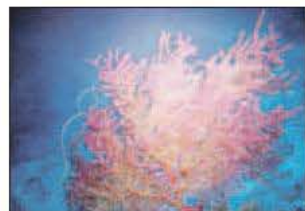
Ragfijn roze is deze structuur in blauw. Het contrast in kleur wekt hier de sprookjesachtige sfeer.